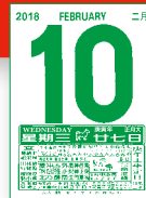
MTCQ87-B2 (16K 日曆芯) MTCQ87-B3 (32K 日曆芯)