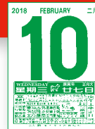
MTCQ88-B2 (16K 日曆芯) MTCQ88-B3 (32K 日曆芯)

■ 月曆縮樣包括圖片及比例乃供客人參考作用，一切以正式樣本為實。 Calendar in this catalogue are for reference only, all subject to original sample. ■