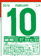
MTCQ85-B2 (16K 日曆芯) MTCQ85-B3 (32K 日曆芯)