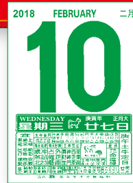
MTCQ83-B1 (8K 日曆芯) MTCQ83-B2 (16K 日曆芯)