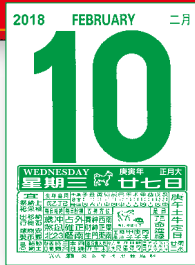
MTCQ81-B1 (8K 日曆芯) MTCQ81-B2 (16K 日曆芯)