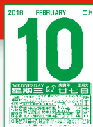
MTCQ86-B2 (16K 日曆芯) MTCQ86-B3 (32K 日曆芯)