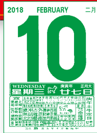
MTCQ82-B1 (8K 日曆芯) MTCQ82-B2 (16K 日曆芯)